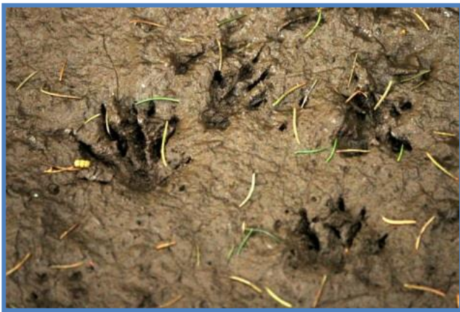
Igelspuren in feuchter Erde, Foto: James Lindsey

Größe des Fußes : ca. 28 mm breit und 25 mm lang